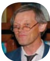
Göran Lambertz, Jur. kand. 1976. Justitiekansler.